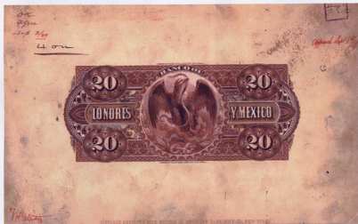
Maquette préparatoire du verso du 20 pesos approuvée en marge en 1889