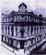
Banco de Londres y Mexico