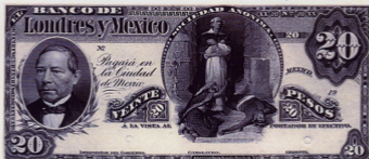
Maquette du 20 Pesos en Noir sans date, sans signatures, sans N°