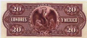
Essai multicolore du Verso du 20 PESOS