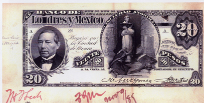
Essai de 20 Pesos en Noir (approuvé en marge) Daté du 1 er juillet 1889, avec 2 signatures, non numéroté