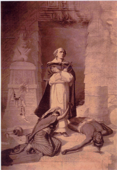
Portrait de LAS CASAS (1484-1566)