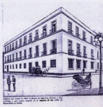
Banco Londres Mexico y Sud America

Pour la petite histoire, cette banque portait le nom en 1867 de Banco de Londres Mexico y Sud America. Elle fut rebaptisée en 1889 Banco de Londres y Mexico.