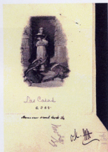
Gravure style « Eau Forte » datée 1890

et de la représentation d'un portrait de Las CASAS, prélat espagnol, né à Séville en 1474, nommé évêque de Chapia au Mexique en 1544 qui défendit les indiens contre l'oppression brutale des conquérants espagnols. (Photo)