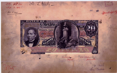
Maquette préparatoire du recto du 20 pesos approuvée en marge en 1889